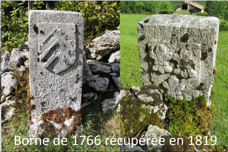
Borne de 1766 récupérée en 1819