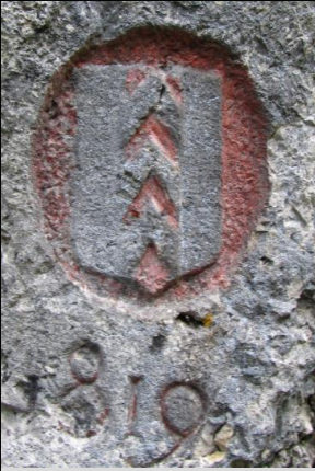
Pal portant trois chevrons