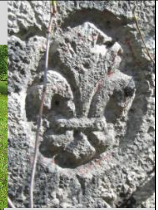
Lys de France 1819

HISTOIRE Les discussions internationales pour doter le nouveau canton d'un territoire militairement défendable se déroulèrent à Vienne et à Paris entre 1814 et 1815. Le territoire historique de la Principauté et Canton de Neuchâtel sera complété à cet effet de la commune française du Cerneux-Péquignot. L'abornement consécutif, réalisé entre 1817 et 1819, finalisera la limite internationale entre Neuchâtel et le Royaume de France. La promenade propose la découverte des bornes-frontière, témoins historiques du bicentenaire du canton, dans un magnifique cadre naturel.