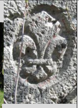
Lys de France 1819

HISTOIRE Les discussions internationales pour doter le nouveau canton d'un territoire militairement défendable se déroulèrent à Vienne et à Paris entre 1814 et 1815. Le territoire historique de la Principauté et Canton de Neuchâtel sera complété à cet effet de la commune française du Cerneux-Péquignot. L'abornement consécutif, réalisé entre 1817 et 1819, finalisera la limite internationale entre Neuchâtel et le Royaume de France. La promenade propose la découverte des bornes-frontière, témoins historiques du bicentenaire du canton, dans un magnifique cadre naturel.